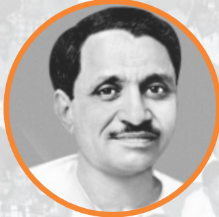
પંડિત દીનદયાળ ઉપાધ્યાય