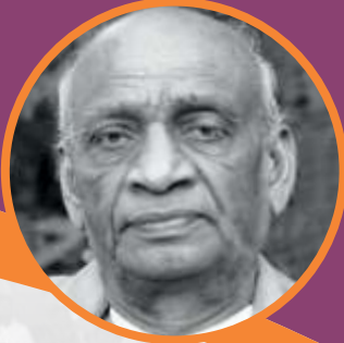
સરદાર વલ્લભભાઈ પટેલ