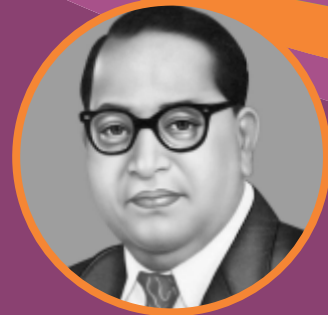
ડૉ. બાબાસાહેબ આંબેડકર